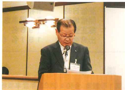
青山公美監事 監査報告

続いて、事務局が定時社員総会議案書に基づき令和5(2023)年度収支予算(案)について説明した。特に浄化槽法定検査手数料については、当年度の検査基数の見通しから令和5年度の計上額を説明した。経常費用に関しては、給料手当、賞与、福利厚生費、退職給付費用のいわゆる人件費に関するものと、それ以外に増減額の大きくなっている勘定科目、金額の大きい勘定科目を中心に説明し、令和4年度予算額と対比しながら説明した。実施事業会計については、愛知県への報告通り実施する計画である旨説明した。