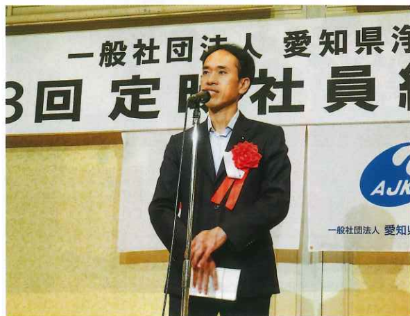
石井芳樹愛知県議会議長