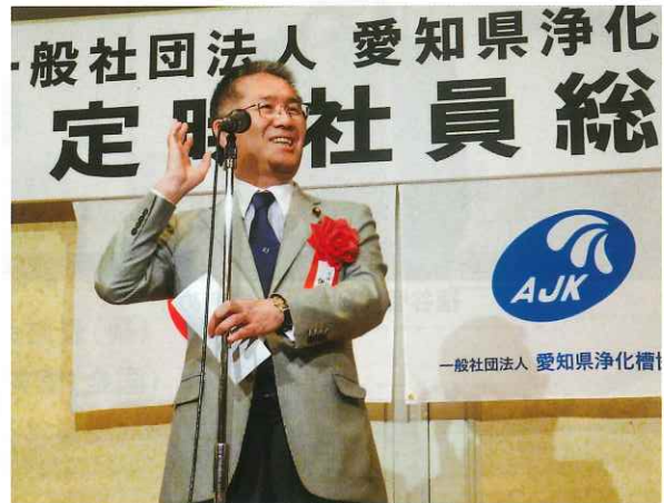
伊藤忠彦衆議院議員