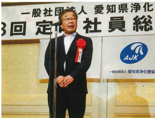
林全宏愛知県副知事 祝辞