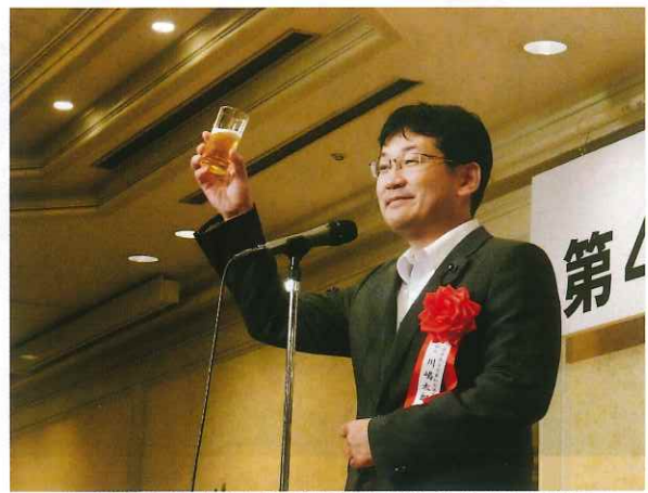
川嶋太郎自由民主党愛知県議員団団長 乾杯