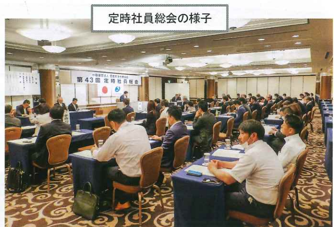
定時社員総会の様子