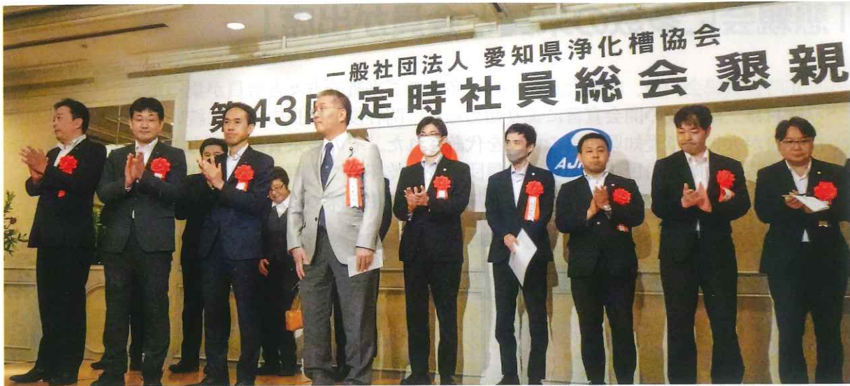
国会、県議会の議員の皆様